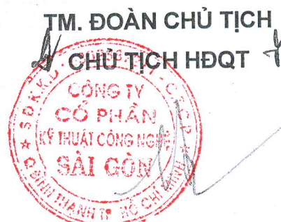
Đặng Công Ngôn